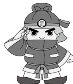
奈良県広域消防組合 マスコットキャラクター 「まほろ隊長」