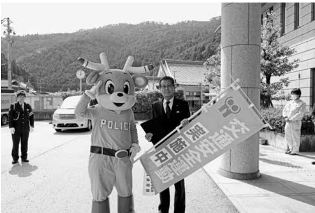
ナポくんが来庁されました