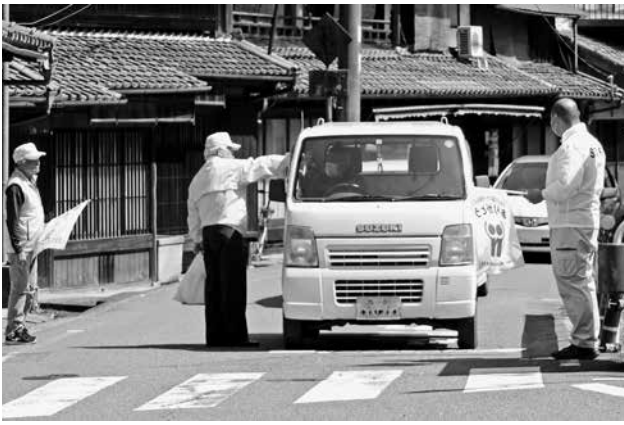
交通安全県民運動の様子

また、9日には桜井警察署と管内市村による交通安全キャラバン隊が来村し、キャラバン隊長のナポくんから交通安全メッセージを受け取りました。日頃から交通ルールを守り、交通事故の無い安全安心な地域の実現を目指しましょう。