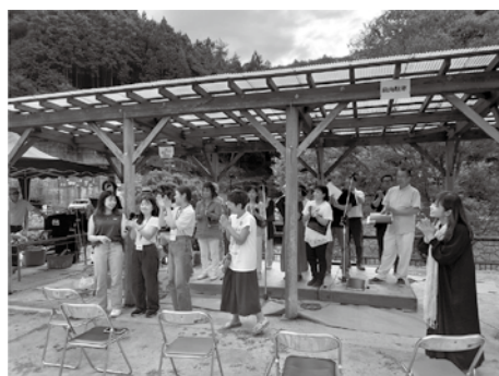
↑急遽一緒に司会をしてくれた学生さんとステージ出演者のみなさん

前日より祭りの準備をしたり、当日は出店の方のお手伝いなど、会場内でたくさんの学生さんが頑張ってくれている姿を目にしました。このような学生さんに関わり合う機会をこれからも設けていきたいと思っております。