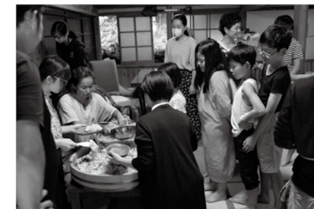
↑学生のみなさんが配膳やこどもとのふれあいなど積極的に参加

学生さんたちが「もしこの先田舎で暮らすとしたら不安に感じる」と、今の世代の率直な意見を聞くことができました。外から見た村の印象や、移住者など村の人に対する感想も聞くことができ、相互に今後活かせる貴重な時間となりました。