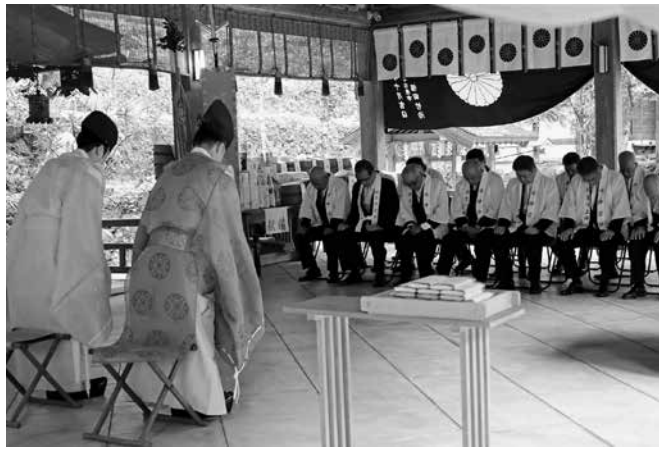
太鼓台奉昇安全祈願祭

太鼓台は威勢よく鳥居をくぐり、拜殿の階段下まで駆け寄ります。 色とりどりの鮮やかな衣裳を身にまとい、担ぎ手と乗子は祭りの最後まで「ヨイヤ サノサイ」（担ぎ手）「ヨイヤ サツ サア」（乗り手）と勇ましい掛け声で境内を練り歩きました。 最後には、八連の太鼓台が一列に並び、一斉に差し上げられると大観衆から大きな拍手と歓声がわき上がり、小川祭りは最高潮を迎えました。