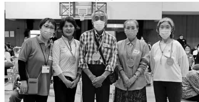
クイズで優勝した6グループの皆さん