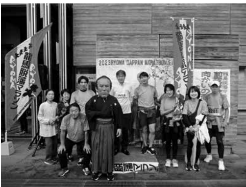
マラソン大会の様子