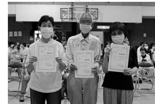
輪投げ大会1位、2位、3位の皆さん