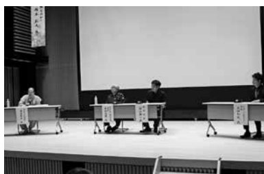
連続講座第13弾 パネルディスカッション