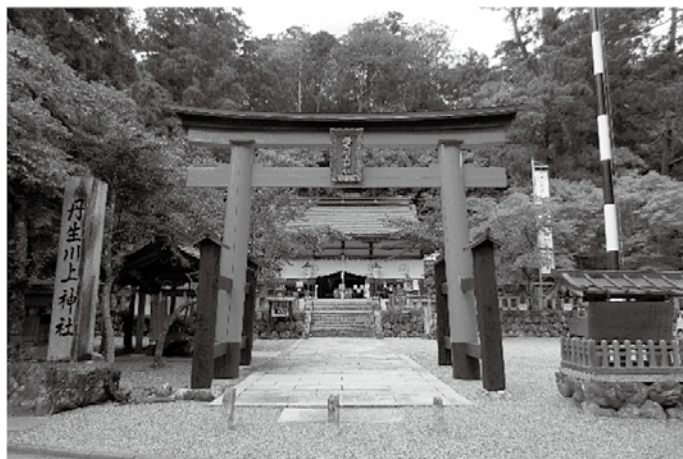
▲写真2 丹生川上神社（中社）

鷲家口から高見川をさかのぼると、水神をまつる丹生川上神社があります（写真2）。社殿に安置されている、平安時代から鎌倉時代にかけて造られた木彫の神像20体は、令和5年（2023）6月、国の重要文化財に指定されました。なかでも、鎌倉時代とされる罔象女神の坐像は、ロンドンの大英博物館で令和元年（2019）に開催された「奈良—日本の信仰と美の始まり」展で、世界中の人々に日本を代表する神像彫刻として紹介されました。