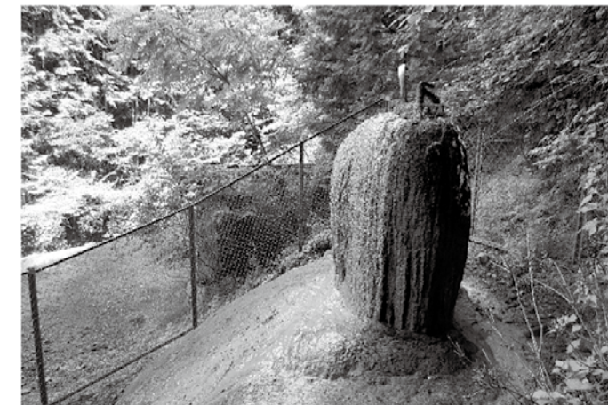
▲写真4 杉谷の噴水塔

杉谷の山中には、高見川の源流で人知れず湧く天然の「間欠泉」があります。現地には、鉄分で真っ赤に染まった高さ1.5mの噴泉塔（間欠泉の成分が固まってタワーのようにもりあがったもの）があり、その頂上から今もこんこんと、高濃度の鉱水（炭酸水素塩泉）があふれています（写真4）。私はこの鉱水が、紀伊半島の基層信仰につながる「丹生」ではないかと考えています。