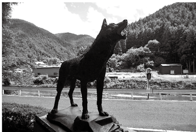
▲写真1 吼えるニホンオオカミ像

村役場のある小川地区の中心地が、旧伊勢南街道沿いに古い町並みを残す鷲家口。江戸時代には紀州藩の本陣・脇本陣が置かれ、大和国でありながら紀州藩領となっていました。この鷲家口で明治38年（1905）に捕まったニホンオオカミの標本（毛皮）は、今イギリスの大英自然史博物館で保管されています。これが絶滅前に確認された最後のニホンオオカミとされ、鷲家口の道沿いに彫刻家・久保田忠和（1927-1990）の手によるニホンオオカミのブロンズ像が建立されています（写真1）。