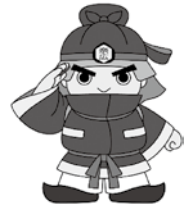
奈良県広域消防組合 マスコットキャラクター 「まほろ隊長」

また、令和5年1月から奈良県広域消防組合管内において、一般住宅の火災による死傷者が多数発生しています。 住宅火災による逃げ遅れゼロ への取り組みとして、下記の4つの習慣・6つの対策を実施していただき、火災から大切な「いのち」を守りましょう。