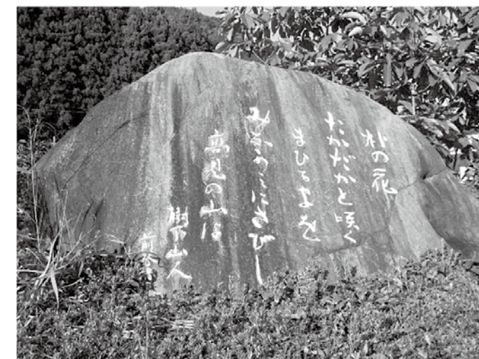
▲写真3 前登志夫の歌碑

さらに高見川をさかのぼると、木津の集落。霊峰・高見山（標高1249m）がよくみえる場所に、吉野を代表する歌人・前登志夫（1926-2008）の歌碑があります（写真3）。