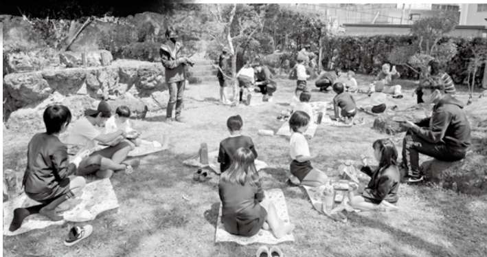
小学校お花見弁当給食