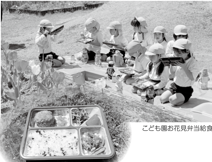
こども園お花見弁当給食

こちらでは、園の花壇に植えてあるチューリップを見ながら、園児みなでお弁当を楽しんでいただきました。