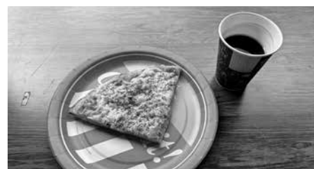
いちたつセット (ピザとコーヒー)

13時以降に村民30名限定で無料配布を行い整理券番号を配るくらい長蛇の列ができました