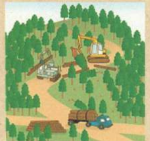
適切に森林整備を推進！

ことから、森林の土地の所有者の把握を進めるため、平成24年4月から森林法に基づく森林の土地の所有者となった旨の届出制度が創設されました。なお、この届出により、森林の土地の所有権の帰属が確定されるものではありません。